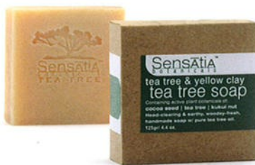
140200 tea tree & yellow clay ティーツリー&イエロークレイ

ティーツリーのエッセンシャルオイルをブレンドしたシリーズ。調合するオイルによって色・香りともにさまざまに変化します。豊かな泡立ちとともに、そのバリエーションをお楽しみいただけます。