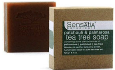
140201 tea tree, patchouli & palmarosa パチュリー&パルマローザ ティーツリー

ティーツリーオイルは、免疫力を高め、バクテリア、真菌、ウイルスの感染を防ぎ、消炎作用のあるイエロースーパーファインクレイは肌の不純物を洗い流し、血行をよくしてくれます。