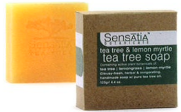
140205 tea tree & lemon myrtle ティーツリー&レモンマートル

ティーツリーオイルは、透明感のある肌作りの手助けもします。スペアミントエッセンシャルオイルは、疲れた心をはげまし、頭痛やストレス、緊張や疲労をやわらげてくれます。