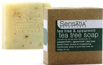
140204 tea tree & spearmint ティーツリー&スペアミント

消炎、殺菌、デオドラント効果があり、一番清涼感のあるユーカリブルーガムという種類を使っています。カジェプトは鎮静作用があり心身を穏やかにし、免疫機能を高めてくれます。