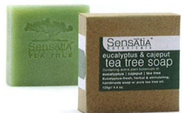
140203 eucalyptus & tea tree, cajeput ユーカリ&カジェプト ティーツリー

ローズマリーは記憶力や集中力を高め、ポジティブな活力を取り戻す効果があります。ラベンダーオイルは気持ちを安らかに静め、不安や緊張、パニックやヒステリー、心身の消耗を和らげてくれます。