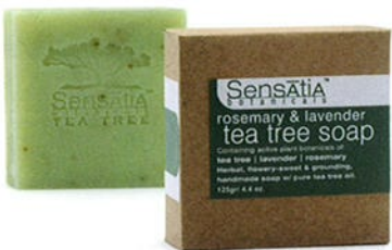
140202 tea tree, rosemary & lavender ローズマリー&ラベンダー ティーツリー

パチュリーは炎症を鎮め、傷や痛みを早くなおし、アクネ、湿疹を抑えます。パルマローザはレモングラスと同じネ科の草本で、落ち着いたトーンの中に、甘く強くゼラニウムに似たアロマが香ります。