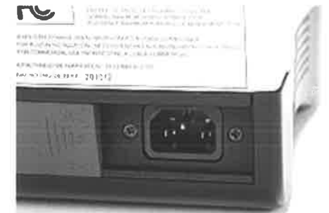
(インバーターAC100V使用時)