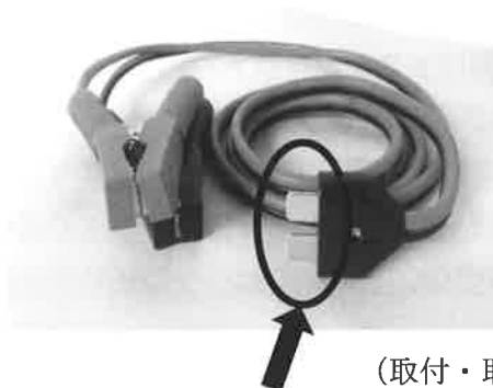
(取付・取外しの注意点)